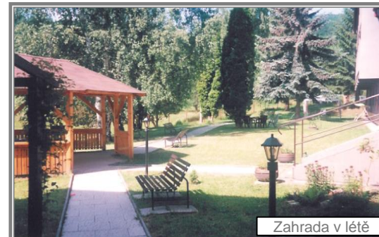
Zahrada v létě