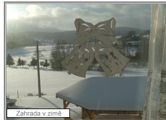
Zahrada v zimě