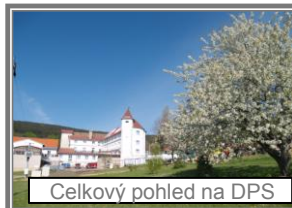
Celkový pohled na DPS