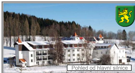
Pohled od hlavní silnice