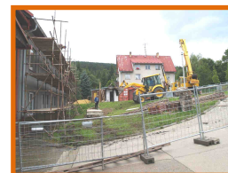
Rekonstrukce pavilonu „C“ a přístavba evakuačního výtahu